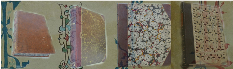
Фиг. 2. Подвързии на книги от 18-ти,19-ти и 20-ти век. CAD инструмента ще има база-данни с изображения на различни стилове подвързии и възможностите за комбиниране с определени книжни тела.

В рамките на проекта ще се разработи инструмент за подвързване под формата на софтуерен модул, с чиято помощ подвързвачите ще показват на своите клиенти как би изглеждала желаната от тях подвързия. Инструментът ще подпомогне качеството и ефективността на работата на подвързвачите, които често са изправени пред неприятната ситуация, в която крайният продукт да не се хареса на клиента, който е имал съвсем друго предвид, давайки поръчката си. Инструментът ще съдържа различни стилове подвързии, характерни за различните исторически периоди, различни видове материали за подвързии и цветове, закопчалки и орнаменти. С помощта на инструмента подвързвачите ще могат да подбират и съчетават по различен начин тези елементи на подвързията, за да покажат на клиентите си как би изглеждал крайният продукт.