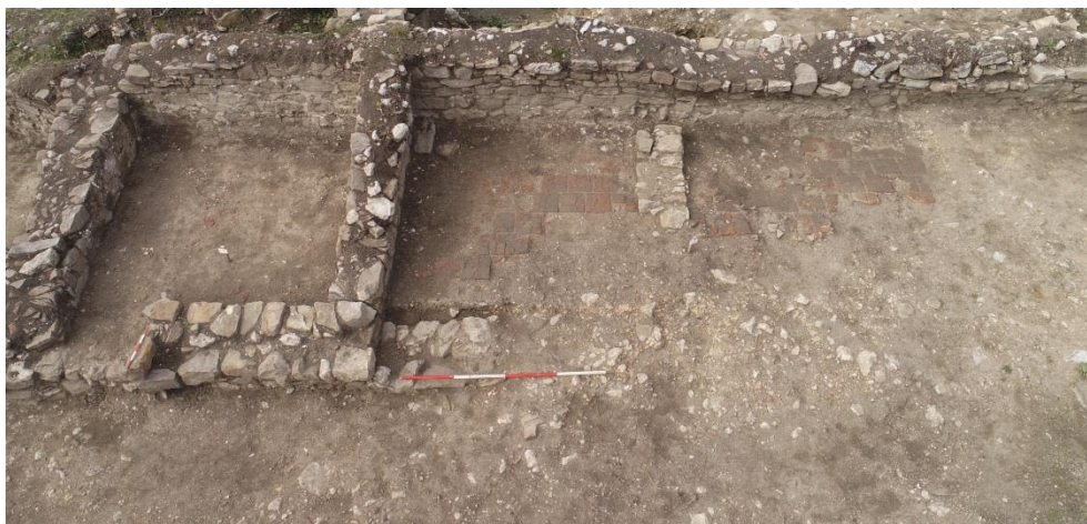
Изображение 3. Западно крило на комплекса

Оградният зид на комплекса затваря обща площ от около 900 м 2 . В плана на западното крило /Изображение 3/ ясно са очертани три помещения, подредени във верижен план. Между последното помещение от север и северния ограден зид при северозападния ъгъл на комплекса, пространството съответства по размер на още едно, четвърто помещение. Такова вероятно е съществувало, също с открита фасада към вътрешния двор, тъй като и в този участък вътрешните стени са измазани с хоросан, напълно идентично с оформлението на интериора на останалата част от крилото.