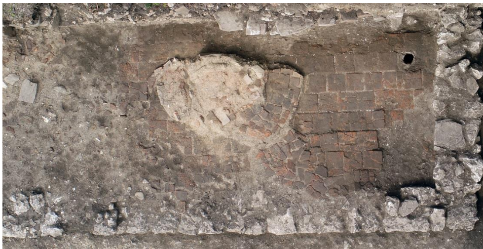
Изображение 4. Северно крило /трапезария/

Вътрешният северозападен ъгъл на комплекса е приблизително 1200 като задава посока на северния ограден зид югозапад-североизток. Това е наложено, за да се обхване максимална площ от север, без сериозно да се засегне конструкцията на югоизточния ъгъл на комплекса при църква №3. От друга страна, това илюстрира и хронологичната последователност тук, като очевидно при изграждането на северния ограден зид, гражданския комплекс от север вече е съществувал.