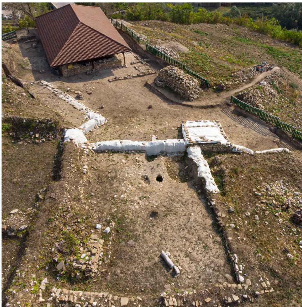
Изображение 7. Архиепска резиденция при църква №4. Поглед от запад

Западната постройка на двуделната сграда е правоъгълна по план. Градена е със средни по големина, добре обработени камъни, с оформени лица, положени в сравнително правилни редове. Споятка е калова. Дебелината на зидовете е 0,80-0,85 м. Ширината на постройката напълно съответства на ширината на терасата.