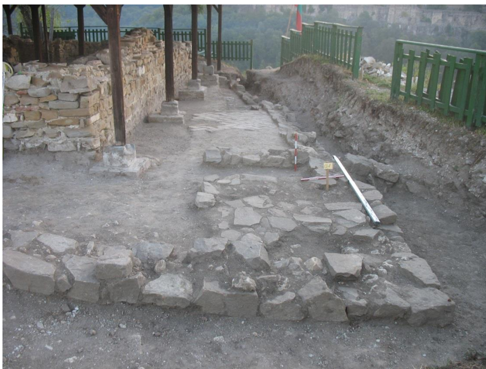
Изображение 5. Църква №4. Странична галерия от юг

Южна галерия /Изображение 5/. Общата ѝ външна дължина е 16,50 м. Стилobatният зид, като нисък фундамент върху който са стъпвали дървени колони като носещ елемент на еднокатен покрив, е двуредов. Граден е от грижливо обработени камъни, средни по големина. Спйката е калова. Полагането на въпросния зид следва естествената конфигурация на скалния венец, в резултат от което планът на галерията не е точен правоъгълника. В западния край ширината на галерията е 2,83 м, а в източния – 1,26 м. Това показва, че самата галерия в последователността на строителната хронология по-късно допълнение към плана на църквата.