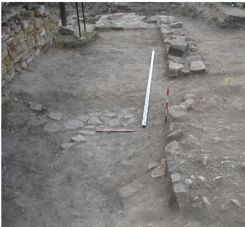
Изображение 6. Църква №4. Странична галерия от запад

пласт, като нивото му равни с останалата част от стилобата. Настилка не се установи. Малък пасаж от каменни плочи е свързан вероятно с обетаването тук в началото на 15-ти век.