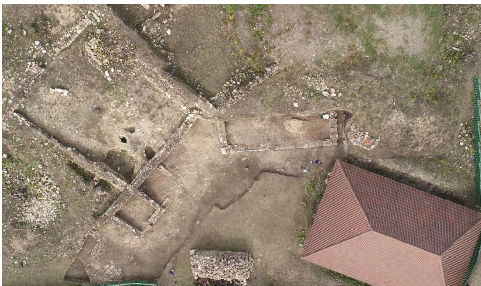
Изображение 2. Комплекс при църква №4 /поглед отгоре/

Така, сам по себе си, новоразкритият представителен ансамбъл не е неочаквано откритие, предвид досегашните резултати в участъка и характера на комуникационната схема в сектора. Тук не на последно място, от съществено значение е и пълното отсъствие на жилищно строителство, организирано в столичен квартал, на съпътстващи структури, на производствени и търговски постройки, некрополи и т.н. В този смисъл тук се оформя градска среда, не предимно, а единствено с граничещи един с друг големи затворени ансамбли, обитавани от представители на столичната аристокрация. С пряк излаз към основната улица на крепостта, вероятно е бил организиран и достъпа до комплекса при църква №4. На този етап, това все още е хипотеза и предстояща проучвателска задача. Видно от плановете решения, мащабите и най-вече от оформлението на крилата, свързани с обетателите на въпросните ансамбли, те са с различно функционално предназначение и несъмнено са обитавани от високопоставени персони с различен статус в столичната йерархия – светски или църковни дейци.