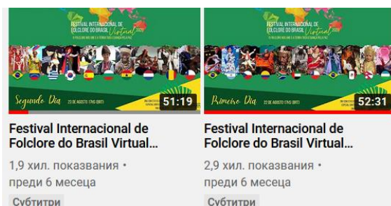
Фиг.2. Видео представяне на фестивалната програма

Паралелните събития бяха насочени към: Отбелязване на 50 години „Ден на Земята“, „Засаждане на дървото на мира“, „Стъпки за мира“, „Поглед на мира“, „Дреха на мира“, „Възпоменателен печат в Пощата“. Участниците се запознават с култура на различни страни, в продължение на два дни, в комфорта на дома си и без да се налага да се качват на самолет. „Фестивалът имаше за цел да спаси, опази и обедини народните култури. Осъществихме обмен с повече от 100 страни“, казва Хелена Луренцо, президент на ABrasOFFA. Двата фестивални концерта са наблюдавани от около 5000 зрители, [Фиг. 2] което за стандартен фолклорен фестивал е също голямо постижение.