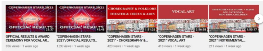
Фиг. 5 Видео обявяване на резултати чрез платформа за видео споделяне

Друг способ за обявяването на резултатите от конкурс е чрез пряко излъчване на церемонията в социални мрежи или платформа за видео споделяне.