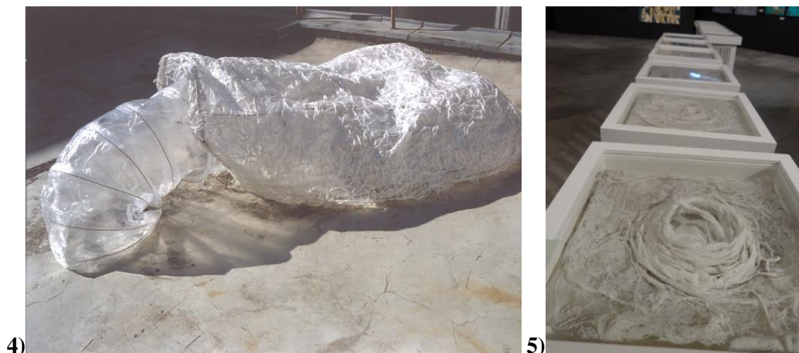
Фигура 4. Моята вътрешна светлина, инсталация, 2004 г.