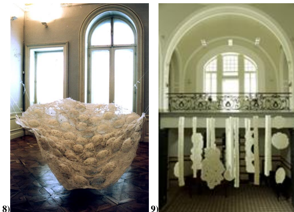
Фигура 8. Инсталация, синтетика, 2002 г.

Според нея „художественият текстил е изградил собствена артистична позиция още през 60-те години на XX век“ и „днес заема авторитетно място в разширените граници на съвременното изкуство“. Именно тези художествени процеси провокират и бележат творческия път на художничката (Фигури 8 и 9).