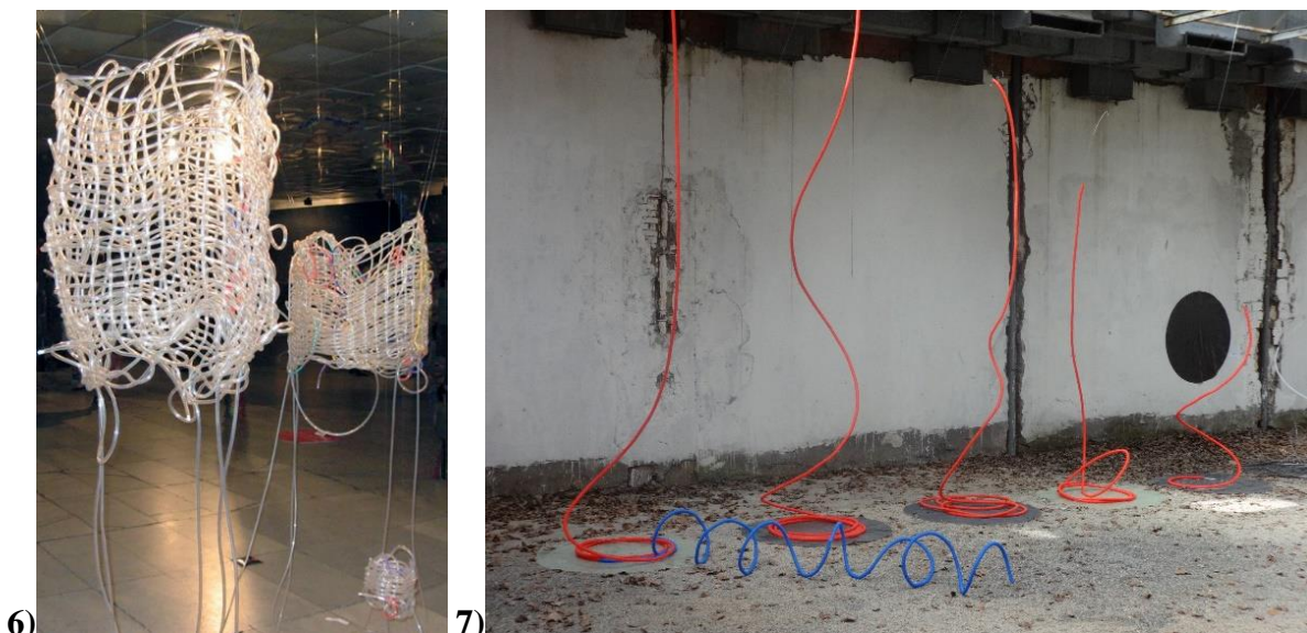
Фигура 6. Дантелено тяло, 2015 г.

надграждана (Tsvetni repliki..., 2011). Това е характерно и за нейното собствено творчество. Тя подчертава 11 значението на новите и нетипични за текстила материали и твърди, че „текстилните творби стоят добре съпоставени със стъкло и други съвременни материали“. Акцентира на характерното за днешното изкуство на текстила обединяване на медиите, разширяване на изразните средства, навлизане на мултимедията, все „неща, които (...) ХХІ век (...) „консумира с пълна сила“ (Фигури 6 и 7).