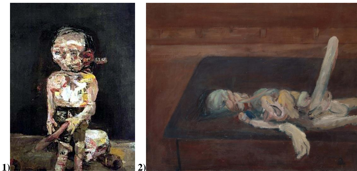
Фиг. 1: Georg Baselitz – „Die grobe Nacht im Eimer“, (1963), 250x180см

Неоекспресионизмът е течение което се развива от 70 -те до около 90 -те години на XX век. Течението оказва влияние и върху редица български автори в различни периоди от творчеството им. Иван Кънчев е един от авторите които работи и продължава да работи в този стил. Задачата на тази научна статия е да докаже принадлежността на творчеството му към неоекспресионизма, което автоматично означава, че в България съществува неоекспресионизъм като течение в изкуството.