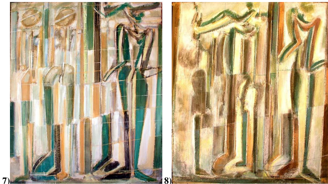
Фиг. 7: И. Кънчев, из цикъл „Интерпретации“