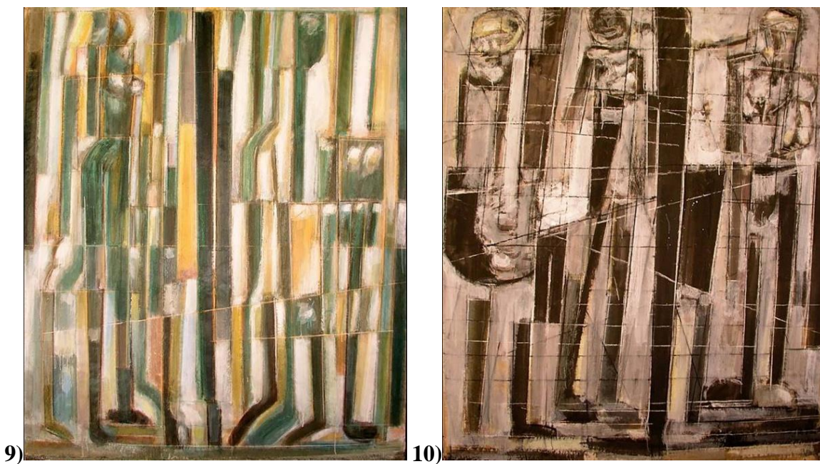
Фиг. 9: И. Кънчев, из цикъл „Интерпретации“