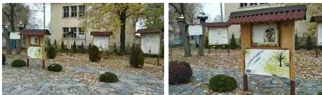
Figure 1. Началото на Алеята на родовете, изградена през 2015 година в с. Климент, във вид на множество постаменти с принтирани табла на родословни дървета, разположени в парк в близост до скромен паметник. Кадри от видеозапис на Слави Котаров, 25 Ноември 2018 (Kotarov, 2018).

Принадлежността към родословие е по-егалитарна характеристика на личността от идеологическите и елитни измерения на съпричастност към ценности и исторически процеси. Изразено в трайни или нетрайни, видими и осезаеми културни форми с различна степен не художествена условност, уважението към местната общност е толкова по-значимо и патриотично, колкото повече представя общността като цяло от отделни носители на традициите. Затова и интересът ни беше привлечен от един скромен родословен парк от петдесетина информационни табла, който съсредоточава местни родови, краеведски и туристически събития и заслужава да се пренася като образцова комплексна практика [Fig. 1], тъй като зафиксира по интересен начин паметта за всички хора равнопоставено – като общност.