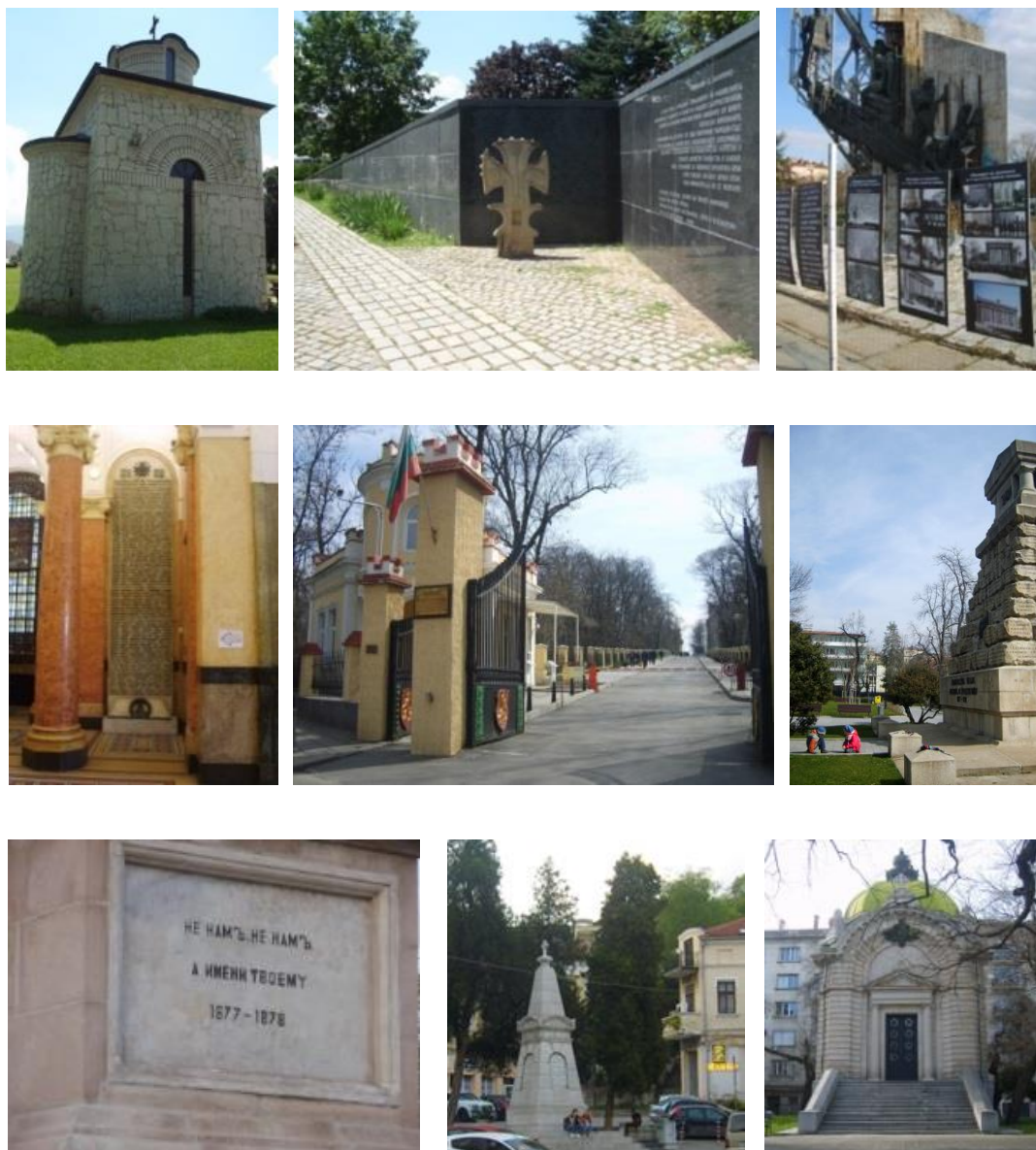
Figure. 2. Военно-историческите мемориали в градска образователна и културна среда не са предимно произведения на изкуството и понякога се заменят.

При високото българско ниво на военно-исторически проучвания и мемориализация 1 , Военната Академия в София все още очаква връщането на изчезналите скулптурни портрети на военачалници от алеята с щикове и