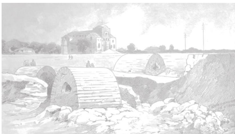
Фигура №1. Църквата „Св. София с некропола“, МИСХ44

Важен извор от този период за наличието и състоянието на някои археологически останки са картините на Й. Обербауер. Особено внимание е отделено на емблематични за града археологически и исторически паметници като: базиликата „Св. София“ и некропола около нея, ротондата „Св. Георги“, крепостната стена на града и други (Kirova and Kasabov, 2010). В гравюрите му са представени и гробници, видими на тогавашния терен (Фигура №1, МИС X 44).