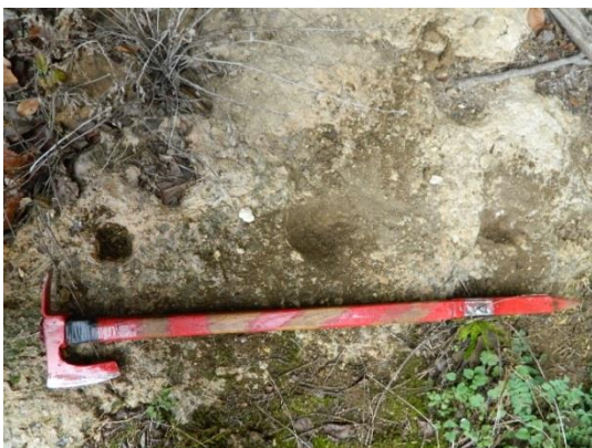
Фигура 6. Изсечени жлебове за двойна преградна стена на пода и на тавана (А)