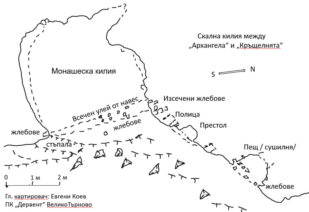
Фигура 1. Скална киля между „Архангела“ и „Кръщелнята“

обичайно, но в настоящия случай издълбаните два реда жлеbove, на разстояние приблизително от около 10 см, свидетелстват, че въпросната ниша е била затворена от двойна стена, направена от лека дървена конструкция от преплетени пръти, вероятно измазани с глина. Двойният ред жлеbove, на какъвто попадаме за първи път при нашите проучвания, освен като свидетелство за съществуваща двойна стена, дава една допълнителна информация за начина на изграждане на монашеските жилища и постигането при тези условия на значително по-голям комфорт за запазване скалното помещение по-топло и по-сухо.