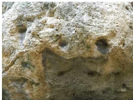
Фигура 7. Изсечени жлебове за двойна преградна стена на пода и на тавана (Б)