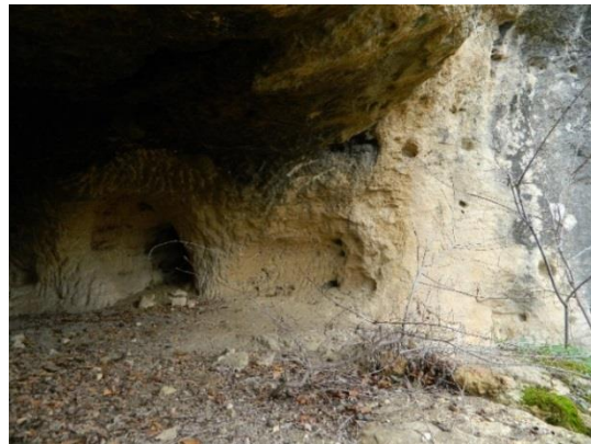
Фигура 5. Скална ниша, северна страна и привходна част с всечени жлебове (Б)