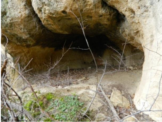
Фигура 2. Скална ниша, вход, общ вид.