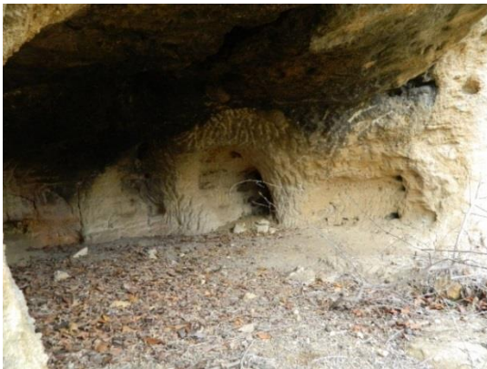
Фигура 4. Скална ниша, северна страна и привходна част с всечени жлебове (А)