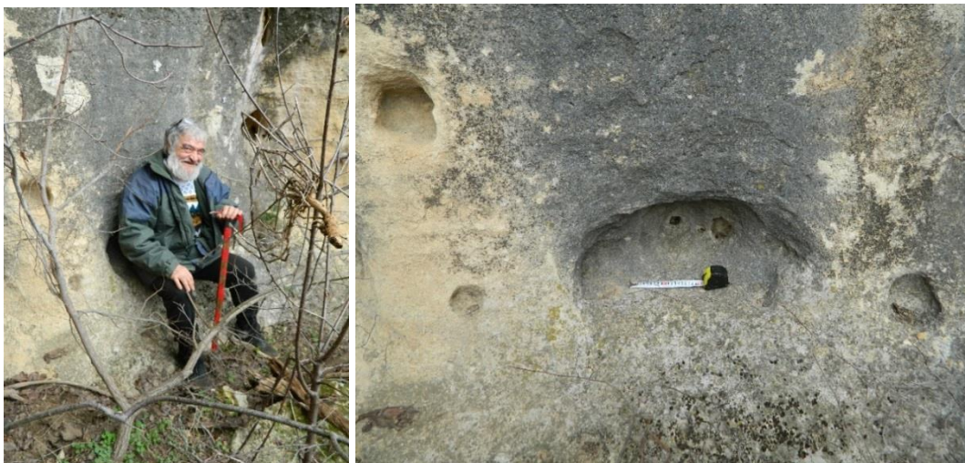
Фигура 8. Скално изсечен престол, лавица и стъпки /основи/ за дървена конструкция (А)