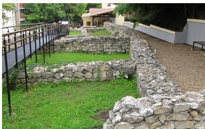
Снимка 5 – Крепост Сексагинда Приста