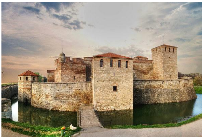
Снимка 1 – Крепост Баба Вида