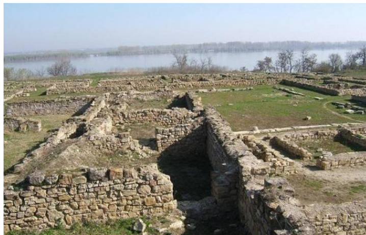
Снимка 4 – Крепост Нове

жилището на командира на легиона и бараките на помощните войски. Цивилното селище е било разположено извън крепостните стени. Постепенно древният град променил облика си, появявали се нови сгради, църкви, работилници на занаятчии. През V-VI век Нове бил и седалище на епископ. Първа тракийска кохорта е историческото название на римски военни части от ауксилиари (помощни войници), съществували през I-IV век сл. Хр. и действали в провинциите Панония, Британия, Юдея, Дакия. В Нове ежегодно се провежда историческата възстановка “Орел над Дунава”. От няколкото ходения до Нове виждам колко добре са се погрижили и възстановили голяма част от римския град (Ivanov, 2006), (Rimskite patishta..., 2009), (Stefanova, 2019).