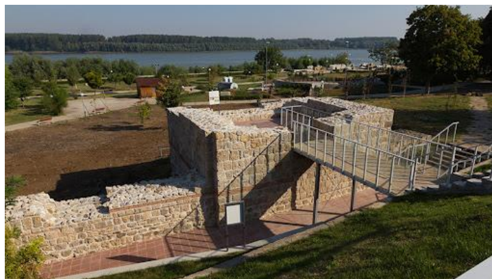
Снимка 6 – Крепост Трансмариска в Тутракан