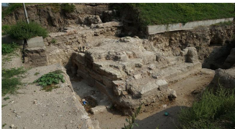
Снимка 2 – Крепост Алмус