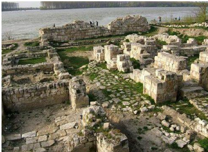
Снимка 7 – Крепост Дуросторум

дължината е 7,90 м. Тя прави чупка в посока север-североизток и се свързва с петоъгълна кула №2 на южната крепостна стена. Проученият участък изцяло е в субструкция и е на кота 14,87 м. Чрез сондажи се установи, че фундаментът е запазен само в първите два реда ломени камъни на хоросан. Крепостта е имала голямо значение за България. През Първото Българско царство Дръстър е бил център на епископия, а след покръстването на българите се превръща в седалище на Българската православна църква. По време на Второто Българско царство Дръстър е митрополитски център (Ivanov, 1999), (Ivanov, 2006).