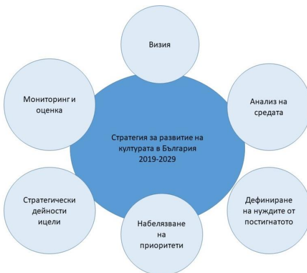
Фиг.1. Стратегия за развитие на културата 2019-2029

В процеса на изграждане на стратегията се обособяват няколко взаимосвързани етапа, които дефинират проблема, анализират средата, формулират потенциални решения. Фигура 1 представя визията на стратегията за развитие на българската култура, разработена на анализ на предходния 10 годишен период и със значение на стратегически документ за следващите 10 години.