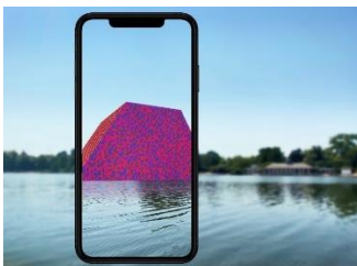
Фиг. 4: Добавена реалност на произведението на Кристо и Жана-Клод - „Мастаба“

Благодарение на безплатното приложение Acute Art (Acute Art, 2021) тази емблематична скулптура се завръща като точно виртуално копие на реалната скулптура, инсталирана през 2018 г. Пренасянето на „Мастаба“ в AR дава на публиката шанс да бъде като художник, поставяйки скулптурата в пейзажите на градините на Кенсингтън и извън него.