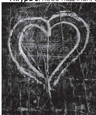
Фигура 10. Брасай, графити серия, около 1950