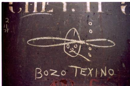
Фигура 8. Хобо надписи, Bozo Texino