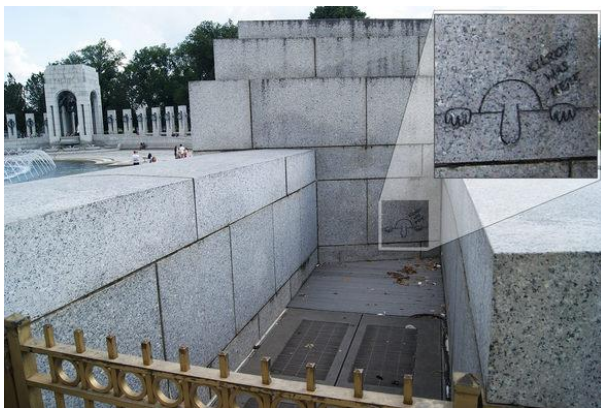
Фигура 13. Килрой беше тук, изобразен върху паметник