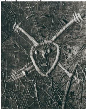
Фигура 11. Брасай, Смъртта, графити серия, 1930-1950