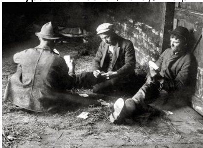
Фигура 5. Трима скитници играят карти, 1915.