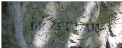
Фигура 3. Й. Киселак, Вахау, Австрия