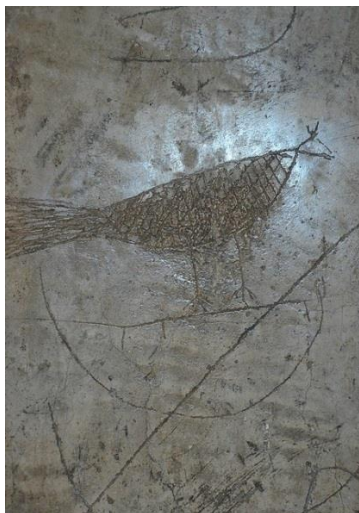
Фигура 1. Помпей, графит на птица, фотография: Carole Raddato