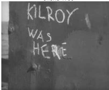
Фигура 12. Килрой беше тук, филмови серии свързани с военни активности, Bikini Atoll, 1946