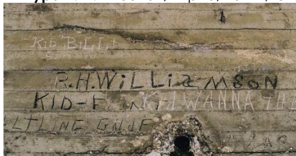
Фигура 6. Хобо надписи (Kid Bill, 1914)