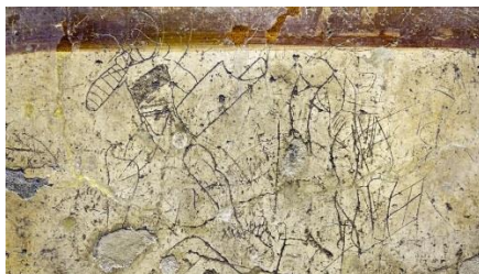
Фигура 2. Помпей, графити изобразяващи гладиатори, национален археологически музей Неапол, фотография: Darren Puttock