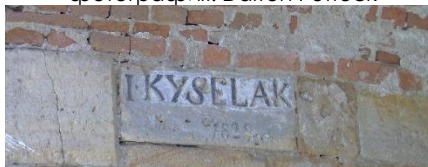
Фигура 4. Й. Киселак, Бърно, Чехия, 1829