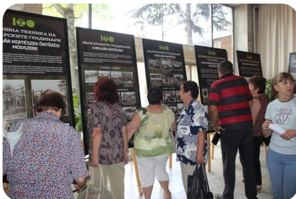
Фиг. 3. Откриване на изложбата „По пътя на българските градинари“ в Регионална библиотека „Стоян Чилингиров“ (10.09.2016 г., гр. Шумен)

Изложбата „По пътя на българските градинари“ обиколи не малко селища в страната (Велико Търново, Шумен, Поликраище, София, Пловдив, Смолян и др.), като по този начин не само трасира един своеобразен културен маршрут, но и провокира не малко хора, свързани по някакъв начин с някогашните градинари-гурбетчи, да се върнат към спомена за предците си и да потърсят материални свидетелства на паметта, останали им в наследство от тях (Фиг. 3, 4).