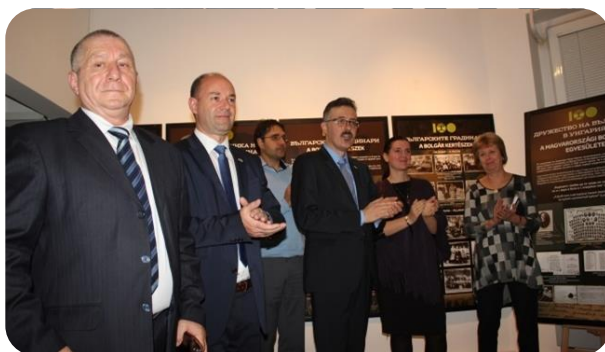
Фиг. 4. Откриване на изложбата „По пътя на българските градинари“ в Унгарския културен институт (17.11.2016 г., гр. София)