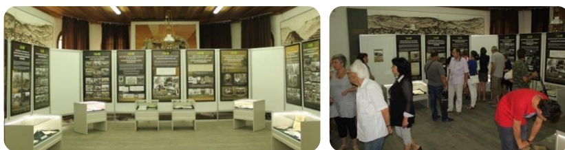
Фиг.2. Мобилна изложба „По пътя на българските градинари“ в музей „Възраждане и Учредително събрание“ (юли-август, 2016 г., гр. Велико Търново)