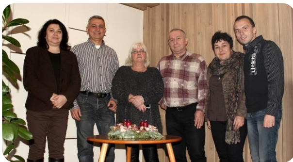
Фиг.1. Научно-изследователският екип на проекта „По пътя на българските градинари“ при разработването му (декември 2015 г., гр. Будапеща)

Видно е че още със създаването си проектът е отворен. Допълнително трябва да се спомене, че и самото му реализиране предполага привличането на разнообразни научно-изследователски, културни и образователни институции и специалисти, от което става ясно, че в него винаги ще има място за още съмишленици, подкрепящи идеята за споделяне и преживяване на общото културно наследство на градинарите-гурбетчии, опазването му като ресурс за устойчиво икономическо и културно развитие, както и вписването му в полето на разнообразната европейска идентичност.