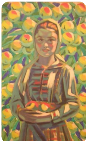
Фиг.18. Девојка, 1949, Х Владимир Димитров- Майстора, ХГ Бургас