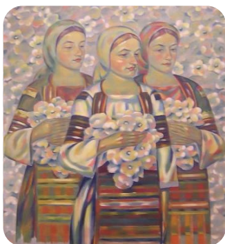
Фиг.14. Три сестри, 1929, Владимир Димитров-Майстора, НХГ

Основния, значимия образ Майстора поставя в центъра на композицията. Центърът – както „центърът на света“ (Eliade, 2012: p. 253), „както всички осветени храмове, дворци и центрове“, където се съединяват небето и земята и представлява „свързващо звено между различните космически равнища“ (Eliade, 2012: p. 254). Елиаде пише, че „плодородието е най-вече свойство на центъра и нерядко неговите символи имат сексуален характер“ (Eliade, 2012: p. 255).