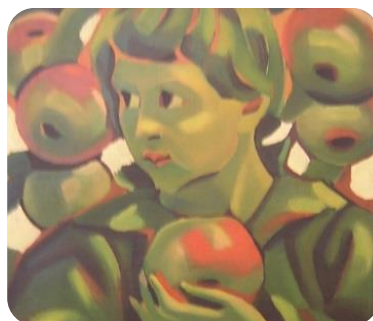
Фиг. 4. Момче с ябълки, 1930, Вл.Димитров-Майстора, НХГ

Мирча Елиаде говори за „Земята-Майка и нейния човешки представител – жената...“, която „имала възможност да обърне внимание на естествените процеси на осеменяване и поникване и да се опита да ги възпроизведе изкуствено. Освен това ... жената придобила особен престиж, тъй като се смятало, че е способна да влияе върху плодородието и разпределянето на произвеждащите сили“ (Eliade, 2012: pp. 277-278). А Майстора рисува с преклонение и възторг тази вълшебница, която дарява живот. „Мистичното единство, тайнствената връзка между плодородието на земята и съзидателната сила на жената е една от фундаменталните структури, дълбинна