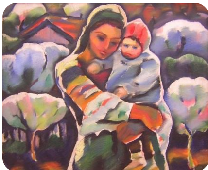
Фиг.5. Майка под цъфнало дърво, 1935, Владимир Димитров-Майстора, НХГ

интуиция за онова, което можем да наречем „земеделско съзнание““ (Eliade, 2012: p. 353).