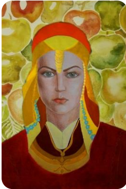
Фиг. 29. Ученическа композиция