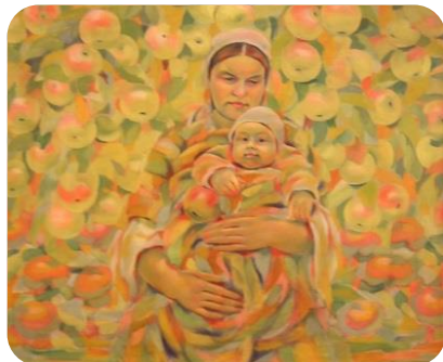
Фиг. 7. Майка с дете, 1935, Владимир Димитров-Майстора, ХГ Кърджали