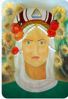
Фиг. 27. Ученическа композиция