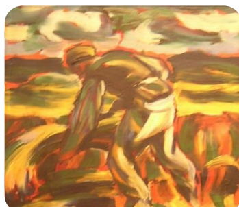
фиг.10. Жътвар, 1920-те, Владимир Димитров-Майстора, ХГ Ямбол

„Свързано с живота, имащо за пряка цел гигантското нарастване на скритите в семената, в браздата, в дъжда, в растителните духове жизнени сили, земеделието е най-вече ритуал. ... Орачът прониква в зона, във висша степен наситена със свещено съдържание.“ (Eliade, 2012: р. 351). Според Елиаде реколтата е „свещена сила“, олицетворявана с „Майката на живота“, „Великата майка“, „Майката на класовете“ (Eliade, 2012: р. 358). Именно за тази Майка се грижи и жетварят на Майстора, с благоговение понесъл житните снопове.