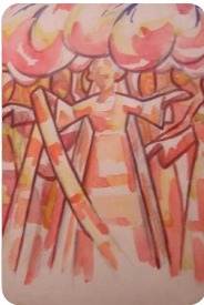
Фиг. 11. Невеста води хоро, 1930-1935, Владимир Димитров-Майстора, ХГ Кюстендил

платното сиянието, което тя излъчва и светлината, бликаща и огряваща благодатно наоколо - на сватбеното хоро, в момента на ръкоцелуването на ръката на свекъра. Извайва образа на булката още по-чист, озарен, великолепен! Усещането за непорочност великият художник засилва с нежни розово-бели цветове над главата на невестата ... и сякаш долавяме уханието им от платното.