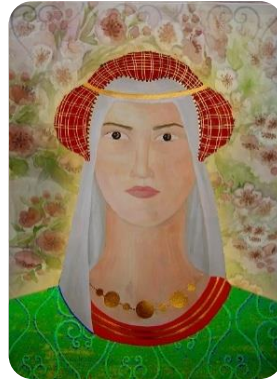
Фиг. 30. Ученическа композиция

Учениците се постараха да приложат знанията си за митологичните архетипи. Работиха в часове по изобразително изкуство и приложен софтуер. Комбинираха нови знания относно теория на визуалната комуникация с умения по изобразително изкуство и компютърна графика. Почувстваха се горди наследници на обичаята от всички нас Владимир Димитров – Майстора.