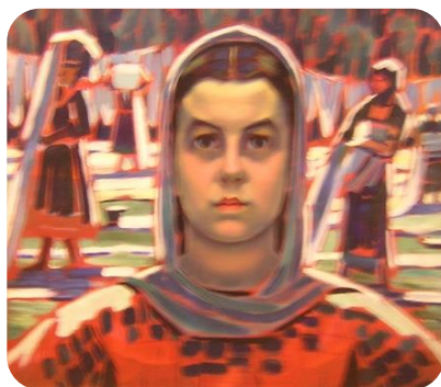
Фиг. 16. Белят платна, 1930, Владимир Димитров- Майстора, НХГ