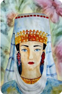
Фиг. 26. Ученическа композиция