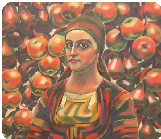
фиг.19. Тодора, 1935, Владимир Димитров- Майстора, ХГ Кюстендил