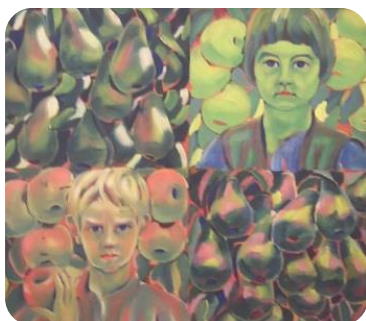
Фиг. 3. Деца и плодове, 1935, Вл.Димитров-Майстора, НХГ