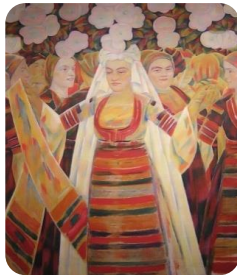
фиг.12. Сватбено хоро 1930-1935, Владимир Димитров-Майстора, НХГ