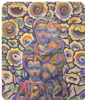
Фиг.6. Майка с деца, 1935, Владимир Димитров-Майстора, НХГ