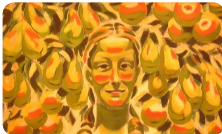
фиг.2. Момиче на фон от круши и ябълки, 1935, Вл. Димитров-Майстора, ХГ Стара Загора