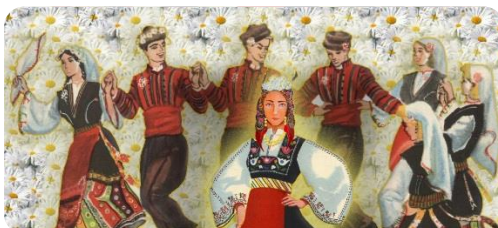
фиг.23. Ученическа композиция