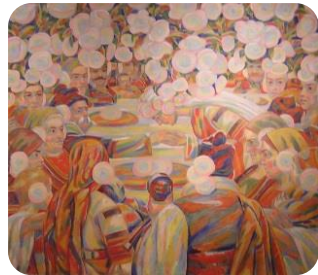
фиг.13. Сватба. Ръкоцелуване, 1935, Владимир Димитров-Майстора, НХГ