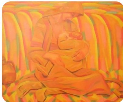
Фиг. 8. Жътварка (На нивата), 1935, Владимир Димитров-Майстора, НХГ