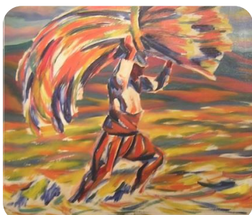
Фиг.9. Жътвар, 1935-1938, Владимир Димитров-Майстора, НХГ