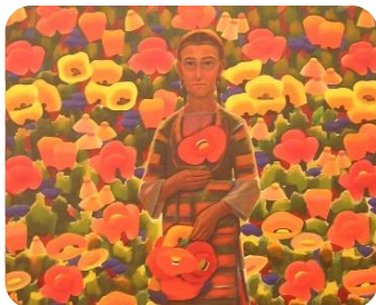
Фиг.1. Момиче с макове, 1930, Вл. Димитров-Майстора, НХГ