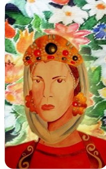
Фиг. 28. Ученическа композиция