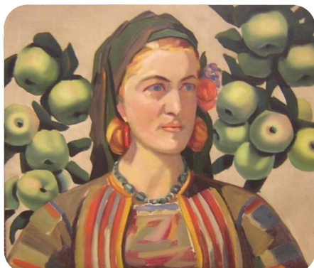
Фиг.20.Мома сред ябълки, 1930,Владимир Димитров-Майстора, НХГ

Нещо повече, художникът ни внушава притежаването на свръхестествена сила на българската жена. Сякаш за неговите картини и за българската мома и невеста Вебер отбелязва „харизма – свръхестествена, свръчовешка или поне специфично извън-всекидневна, надарена с недостъпни за всеки друг сили и качества,...богоизпратена...“ (Veber, 1992: p. 65).