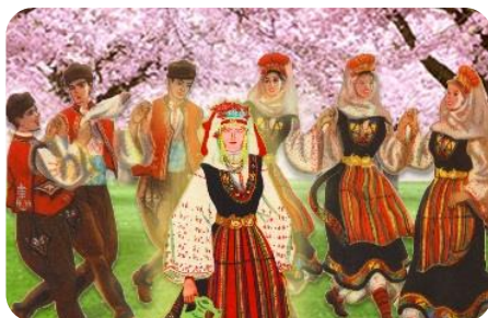
Фиг. 24.Ученическа композиция