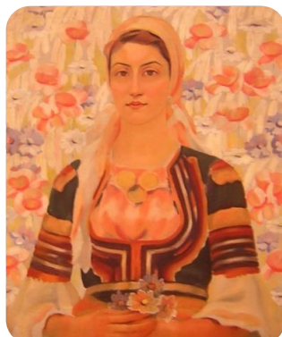
фиг.21. Мома от Калотинци, 1929-1930,Владимир Димитров-Майстора, НХГ

Рисувайки, Майстора се прекланя пред красотата и изящството на живота и с радост и възхищение неуморно го отразява на платното. Архетипите на центъра, сияйната топла светлина и силата на женското начало са приложени интуитивно от Майстора в неговото творчество. И вероятно допринасят за силата на въздействието на Майсторовите образи. Долавяме голямата любов, с която големият български художник ги създава.