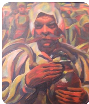
Фиг. 17. Жътвар, 1938, Владимир Димитров- Майстора, НХГ