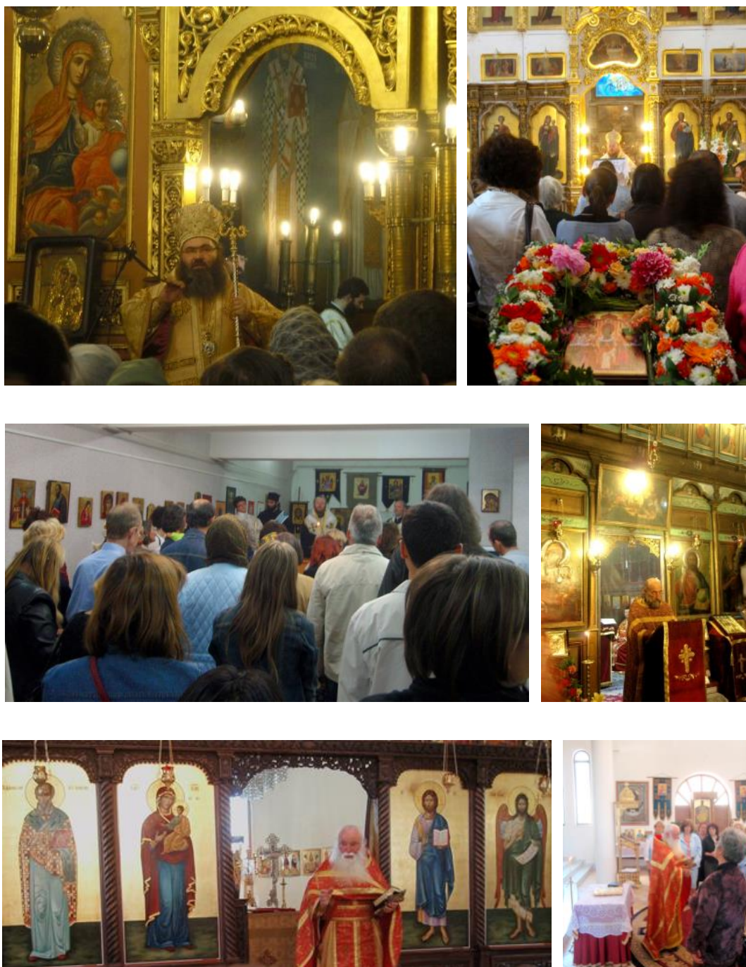
Fig. 3. Проповеди на викарни епископи, архимандрит и енорийски свещеник на Света Литургия и водосвет при откриване на изложба в енорийски център и при посрещане на поклонници, през 2000-те.

Alexandrov, 2007), когато това е бил начин за обособяване на национална църква.