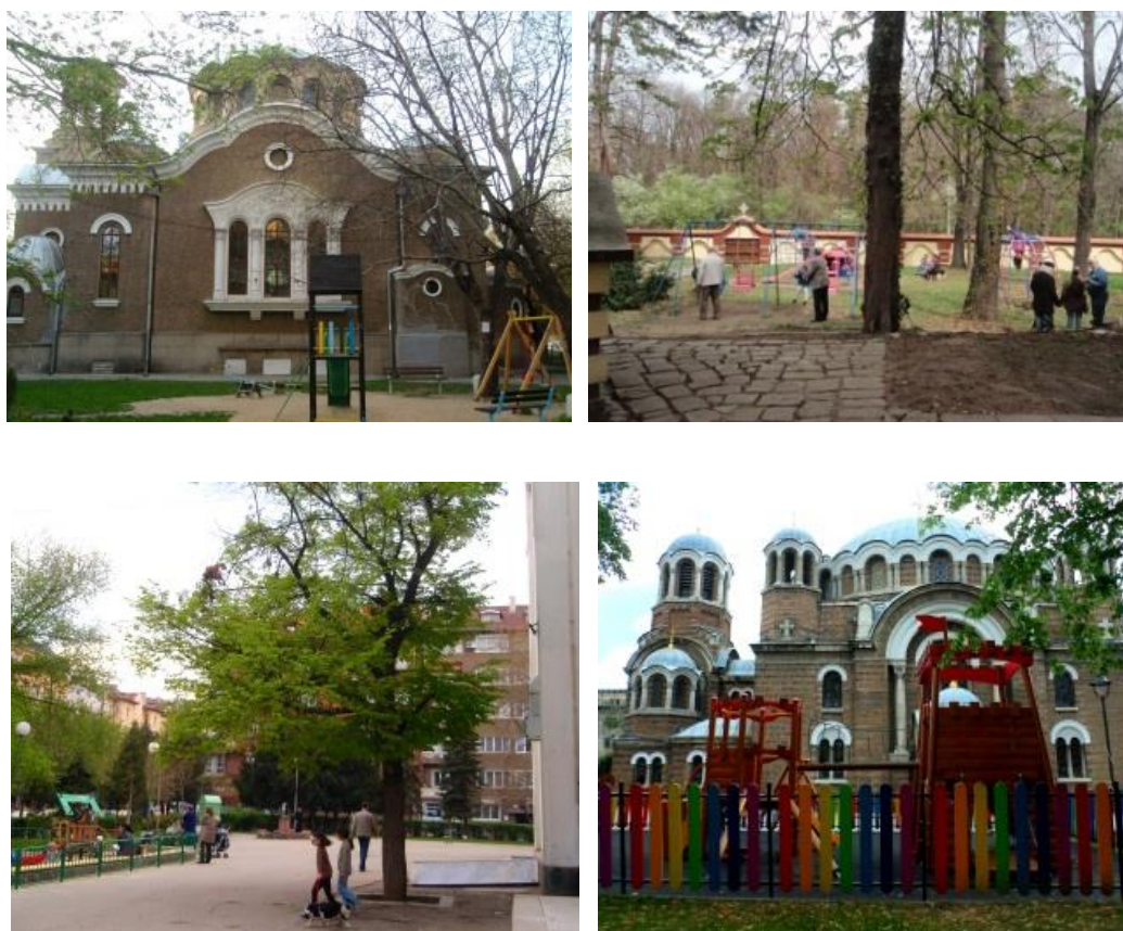
Fig. 2. Съвременни детски площадки при старинни столични храмове и енории.

за тайнства, празници и литии. През XXI век, отначало детските кътове се срещат по-често в светите места, както и беседките и пространствата за събори, които улесняват заниманията и честванията на открито, както и поклонническия туризъм, не само веднъж годишно. Балансират се традиционните пространства за посетители и обитатели (фестивални и богослужбни), стопанските са по-слабо представени, а всяка от тези зони, още в миналото е съобразена за съответна натовареност от шум, движение и достъпност за фотографиране и видеозаснемане.